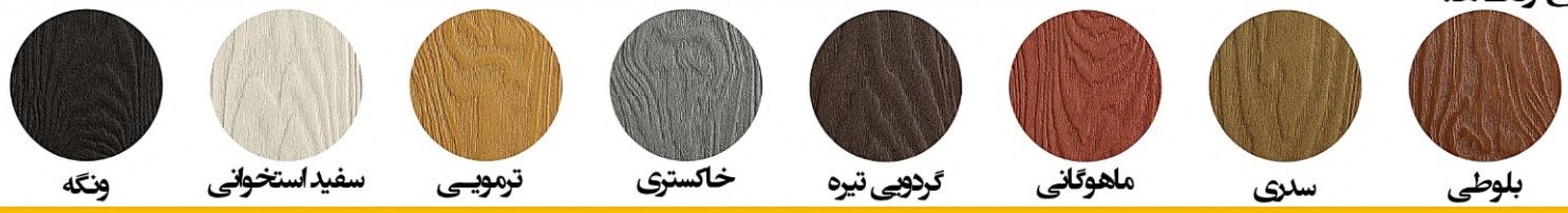
ونگه سفید استخوانی ترمویی خاکستری گردویی تیره ماهوگانی سدری بلوطی